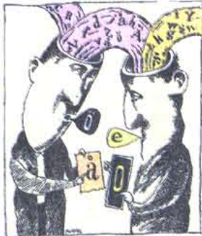
Kieli yhdistää ja erottaa. Nyt alkava sarja tarkastelee kielen ilmiöitä.